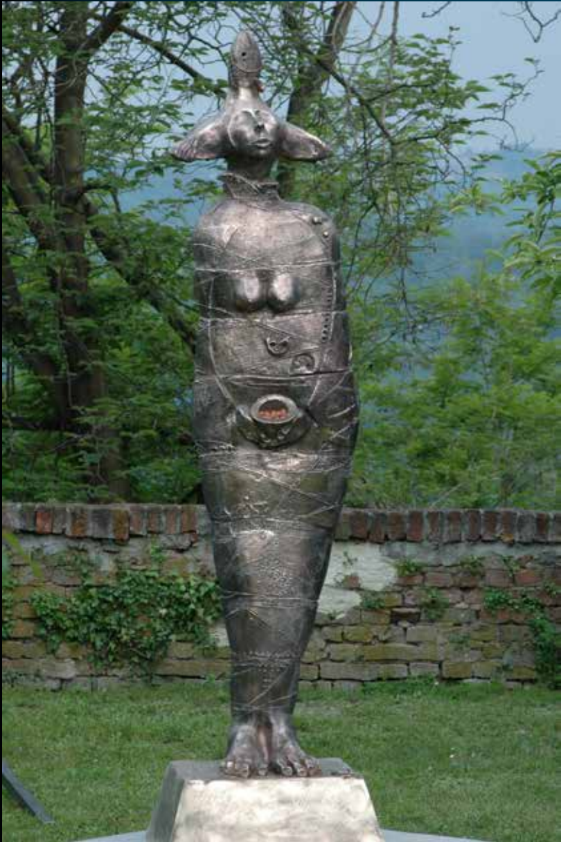
"Fictilia" - bronzo e terracotta - altezza cm. 240 - anno 2004